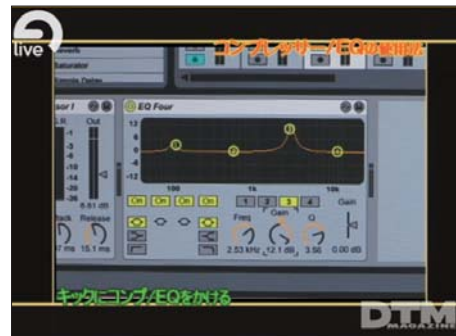
写真3 ハイクオリティなエフェクト。ビデオでは高度な使い方を紹介している。