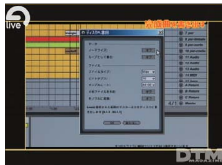
写真6 いよいよ完成! 書き出したい部分を指定し、レンダリングを始めるよう。