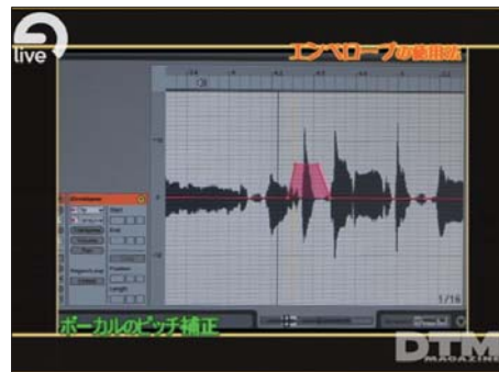
写真5 ピッチ補正も緻密かつ正確に行なえる。DAWにこの機能が含まれるのが大きなアドバンテージとなる。

6回にわたるこの作曲講座はいかがだったろう。初/中級者はこれを見ることによってかなりのスキルアップが計れるし、上級者にも新たな発見があったことと思う。「Live5」の使い方はひとつではない。作り手に合わせて柔軟に対応してくれるソフトなので、使い込むことでより馴染んでくるはずだ。ぜひお楽しみいただきたい!