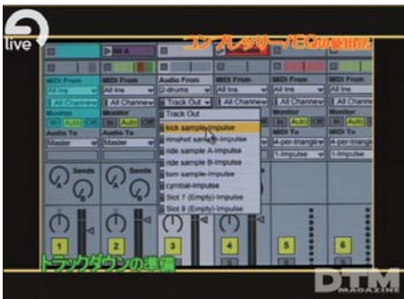
写真2 さらに「Impulse」の各音をわけてアサインすることも可能。緻密なミキシングには欠かせない。

ビデオではもともと以前のバージョンから評判の良い Live の付属エフェクト、オグジュアリの使用例についても紹介しているので、ぜひご覧いただきたい。