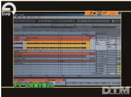
写真4 ギターの奏法にしたがってクリップを分け、音量調節する。視覚的に把握できるので作業効率が高い。

ミキシングにおいて大事な作業に音量バランスの調節がある。個々の楽器のバランスを取る場合、大抵楽器はトラックごとに分かれているのでそのトラックのフェーダーを使えば良いし、ソフト音源によるドラムの場合は先程のようにトラックを分ければ良い。ただ、今回の楽曲のギターのように同じトラックに録音された楽器の場合、奏法により著しく音量が変わるものがある。「Live5」ではこのようなときでも、クリップをアルベジオ、ストロークといった部分ごとに分け一気に音量を調節できる。他のDAW同様に音量カーブを描いていくことも可能だが、クリップごとに調整するほうがはるかに作業が早いのだ。